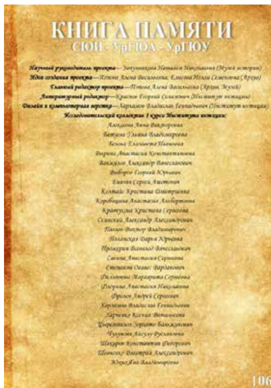
Список студентов и сотрудников, работавших над «Книгой Памяти»