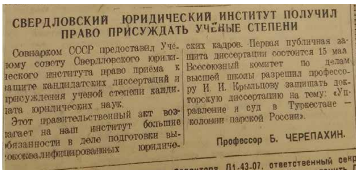
Фрагмент газетной публикации (экспонат передвижной выставки на ЕАПК)

В основном в военное время в СЮИ обучались женщины 1 . Студенты Института помимо учебной деятельности занимались различными работами на общественных началах: трудились в тылу, на заводах, выезжали в колхозы для уборки урожая, участвовали в строительстве оборонных объектов, в заготовке топлива, продовольствия, кормов 2 . Кроме того, Институт помогал госпиталю, и студенты принимали раненых, работали медсестрами и санитарками, выступали с концертами. При этом сохранялся высокий уровень знаний: в дипломах были оценки «отлично» и «хорошо».