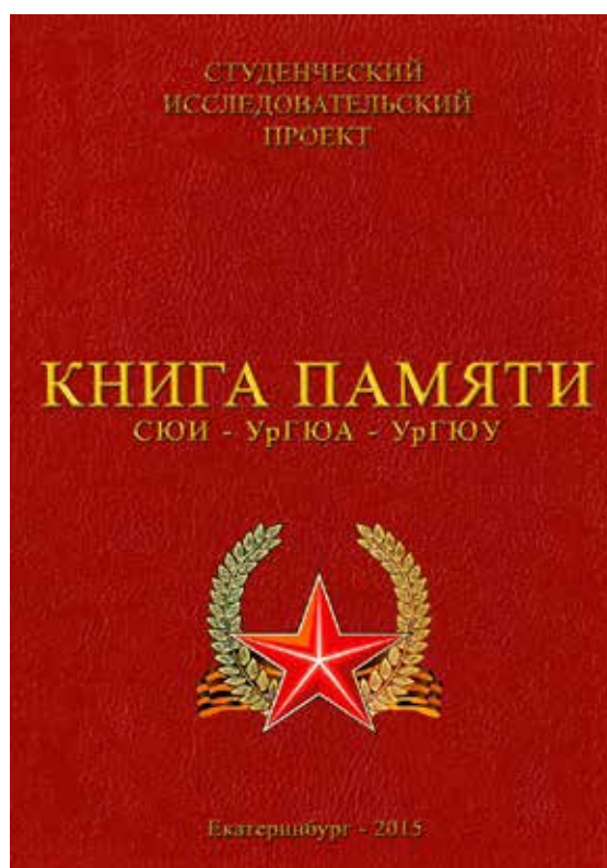
Окончательный вариант обложки «Книги Памяти СЮИ – УрГЮА – УрГЮУ»