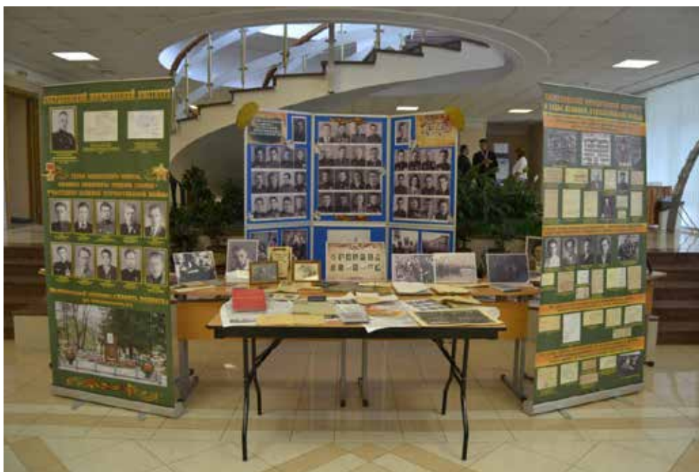
Экспонаты передвижной выставки на ЕАПК