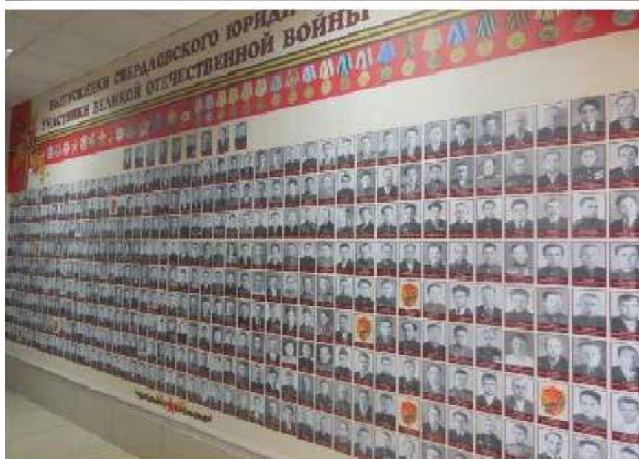
Баннер с портретами орденосцев-выпускников СЮИ