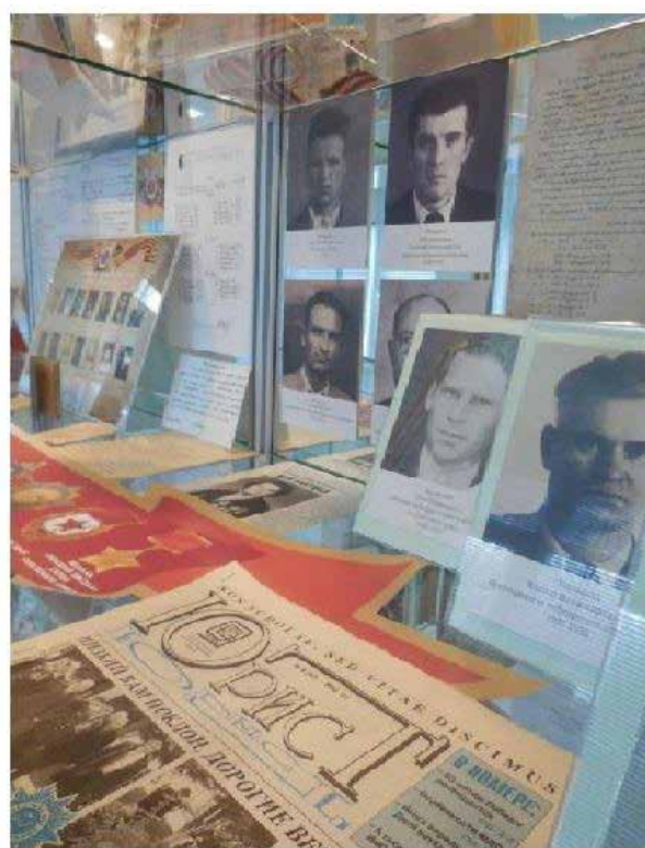
Фрагмент выставки, посвященной 70-летию юбилею Победы в Великой Отечественной войне

Основой выставки стали архивные документы, которые экспонировались впервые: фотографии, приказы, воспоминания преподавателей, сотрудников, студентов Свердловского юридического института, участвовавших в Великой Отечественной войне.