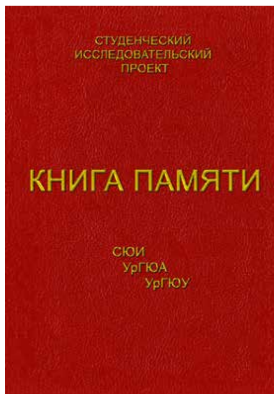
Первоначальные варианты обложки «Книги Памяти СЮИ – УрГЮА – УрГЮУ»