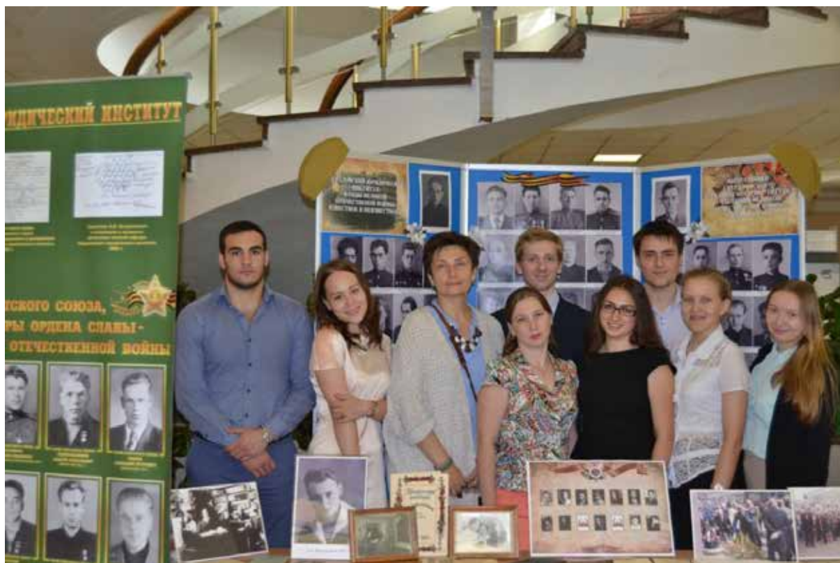
Передвижная выставка на ЕАПК

18–19 июня 2015 г. в здании Правительства Свердловской области была организована девятая сессия Европейско-Азиатского правового конгресса «Право и национальные интересы в современной геополитике». Конгресс объединил делегации разных стран: Белоруссии, Бразилии, Индии, Германии, Китая, Казахстана, Нидерландов, Польши, США, Украины, Франции, Швеции, ЮАР. Всего на форуме встретилось более 700 участников. Студенты-исследователи подготовили к конгрессу передвижную выставку «СЮИ в годы Великой Отечественной войны: известное и неизвестное».