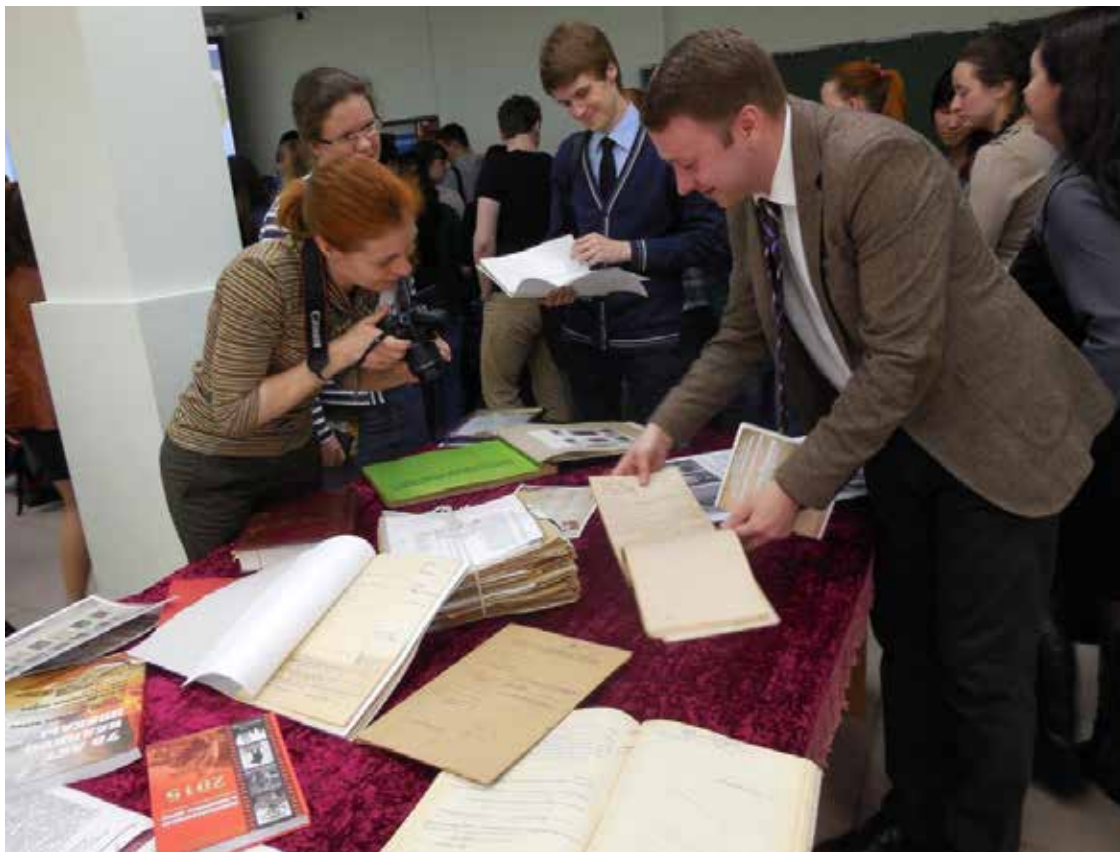
Выставка в рамках «круглого стола»

Также в рамках «круглого стола» была организована тематическая выставка, состоявшая из архивных документов и музейных экспонатов, часть объектов была использована при составлении «Книги Памяти».