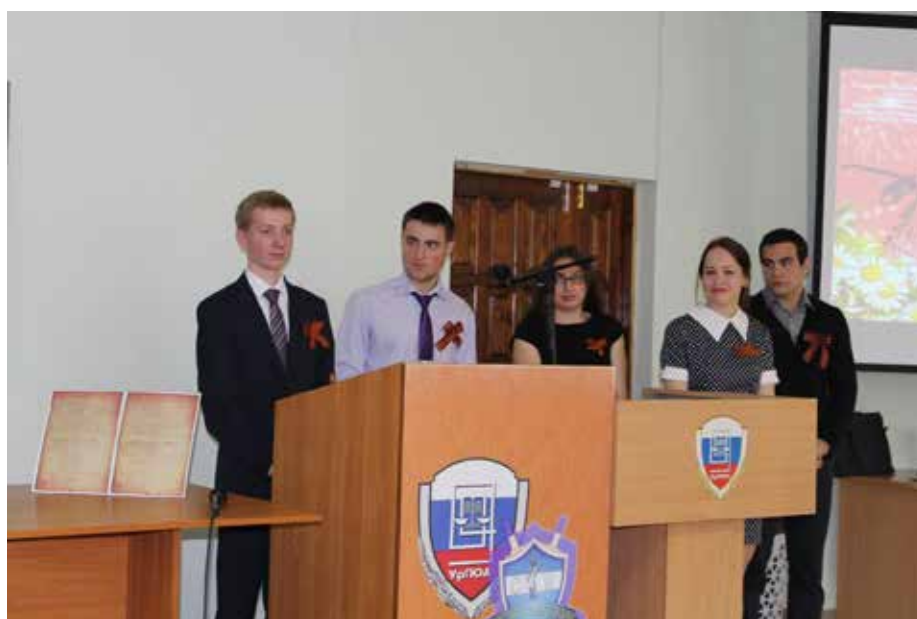
Участники «круглого стола»