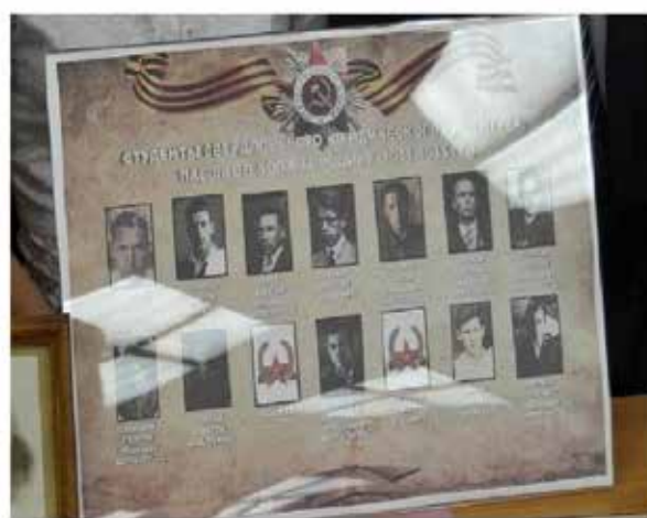
Экспонаты передвижной выставки на ЕАПК

Особое внимание участники конгресса уделяли оригиналу зачетной книжки С. С. Алексева, почетного профессора Университета, выпускника СЮИ, создателя уральской научной школы права, одного из авторов текста Конституции РФ. В ней гости видели только отметки «отлично».