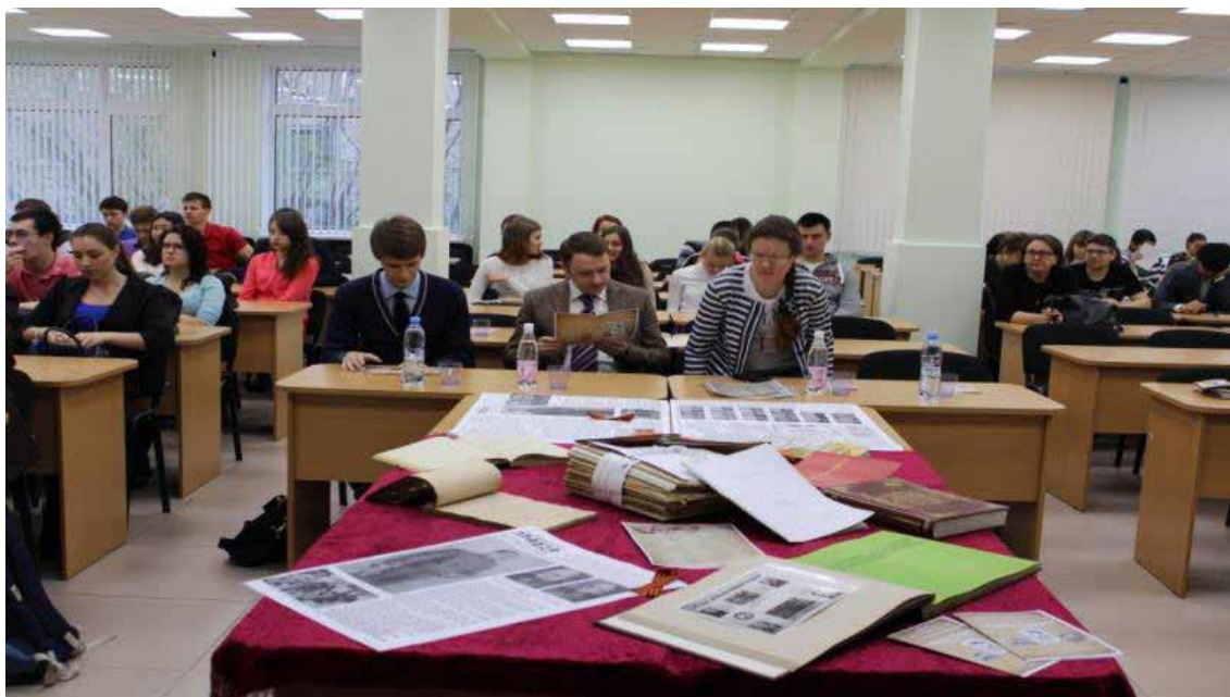
Презентация «Книги Памяти СЮИ – УРГЮА – УРГЮУ»

Важной задачей студентов-исследователей стала разработка стратегии презентации «Книги Памяти». По словам студентов, организация и проведение презентаций несколько не уступали по сложности созданию самого сборника. Однако эта сложность компенсировалась возможностью реализовать свои творческие способности. Подготовка к проведению «круглого стола», на котором должна была пройти презентация «Книги