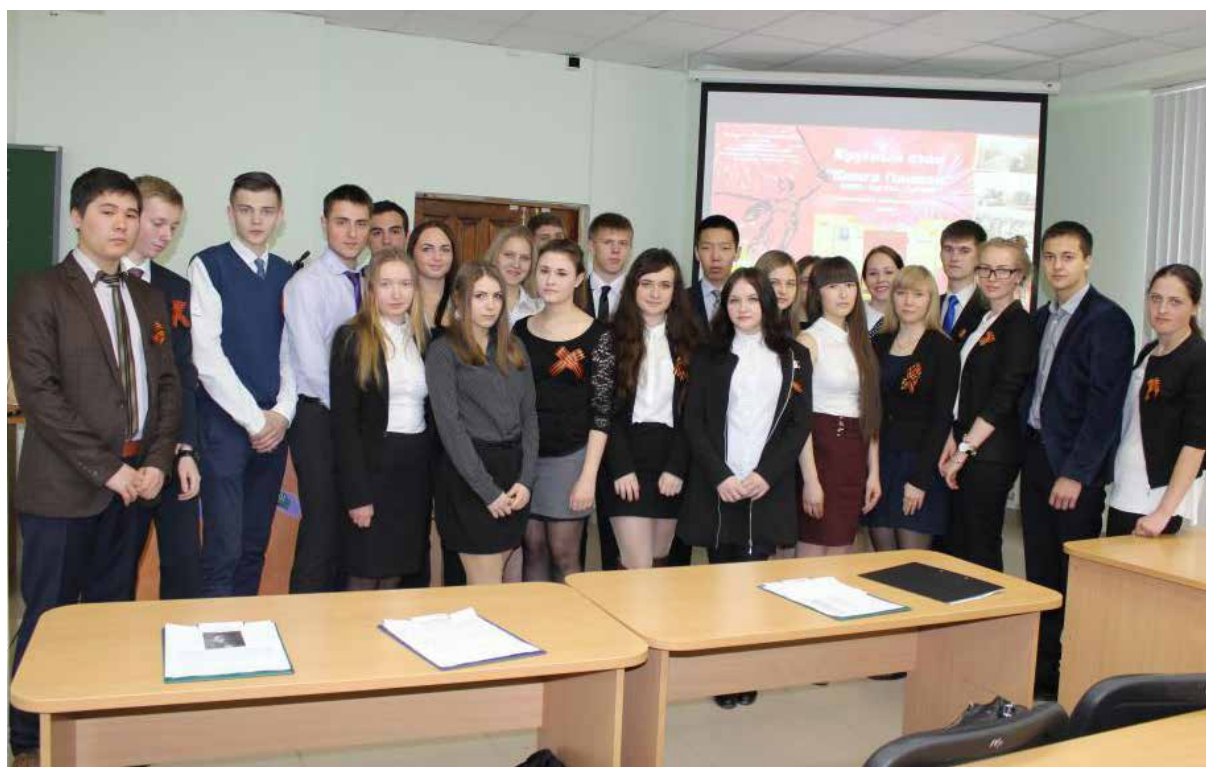
Участники «круглого стола»