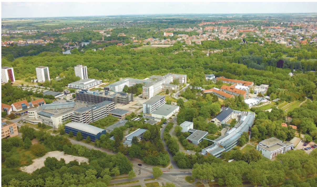
Кампус Вайнберг (северо-запад), вид сверху. Luftbild Weinberg-Campus Nordwest.