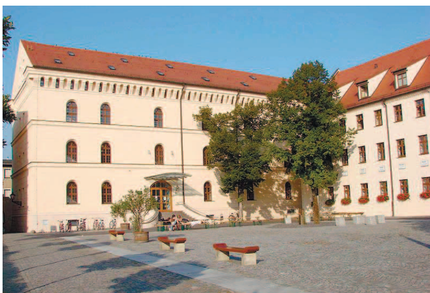
Северный внутренний дворик здания Leucorea (учреждения публичного права).