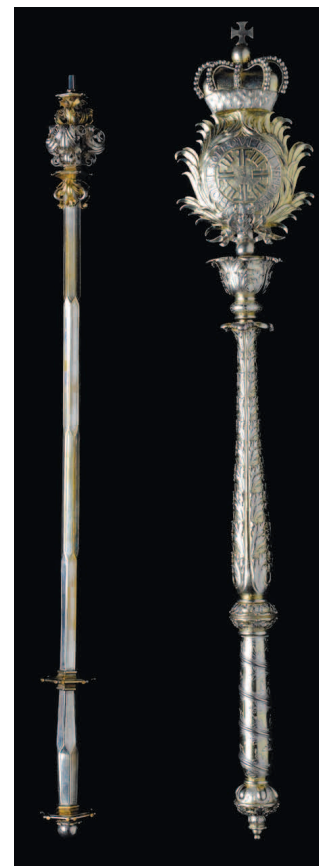
Скипетр университета Виттенберг 1509 г. (слева) и скипетр университета Галле 1694 г. (справа).

Sammlungsschrank im Universitätsmuseum.