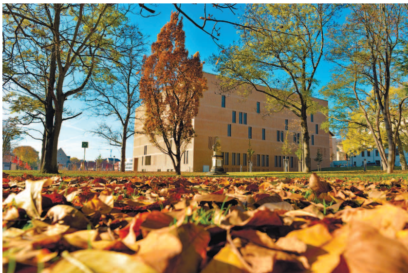
Отраслевая библиотека кампуса Штайнтор.