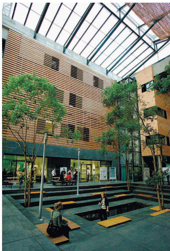
Biologicum университета Галле. Biologicum der Uni Halle.