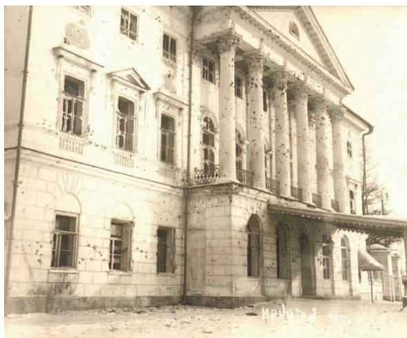
Здание Иркутского университета, где начал работу юридический факультет. Иркутск, 1928 г.