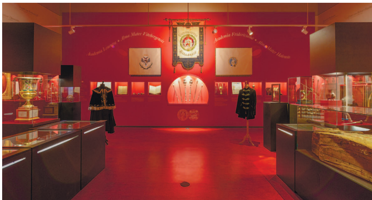
Музей университета МЛУ.

In den letzten 5 Jahren, also seit 2012, wurden die Sammlungen wiederhergestellt, studiert und beschrieben mit dem Ziel, ein sorgfältiges Studium der Hochschulgeschichte, insbesondere mit Blick auf das Rechts- und Hochschulsystem des Landes, zu ermöglichen.