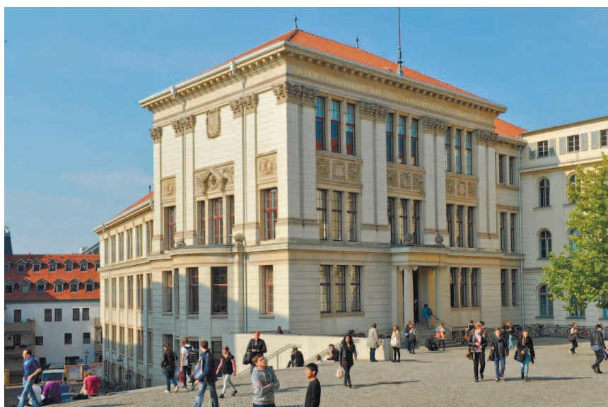
Здание Melanchthonianum на университетской площади.