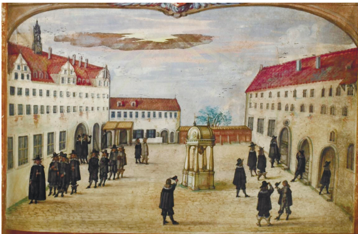
Взгляд на общий дворик старого Университета Виттенберга с профессорами и студентами, иллюстрация из Виттенбергских матриц, осенний семестр 1644 г.