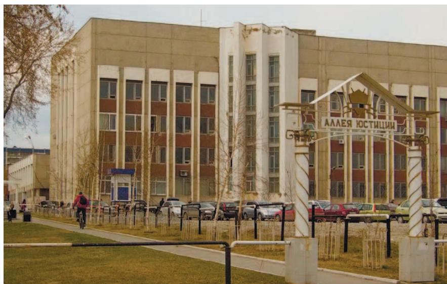
Lehrgebäude Nr. 2. Ekaterinburg, Kolmogorova Str. 54.