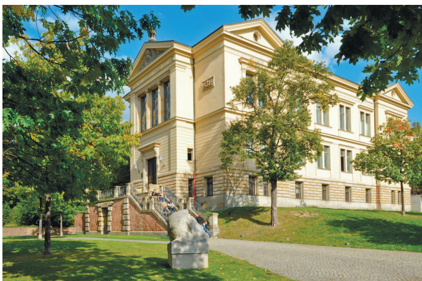
Музей археологии «Робертиниум» на университетской площа- ди.