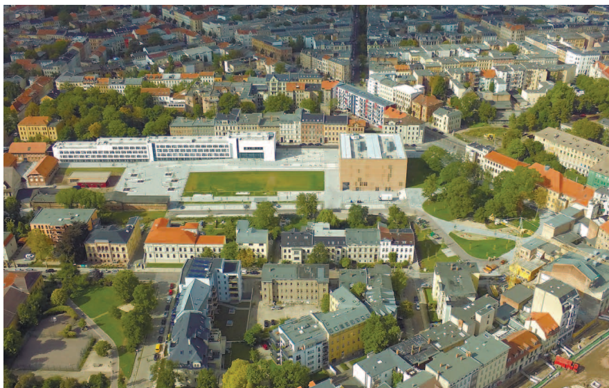
Кампус Штайнтор, вид сверху.