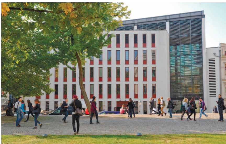
Здание Juridicum рядом с университетской площадью.