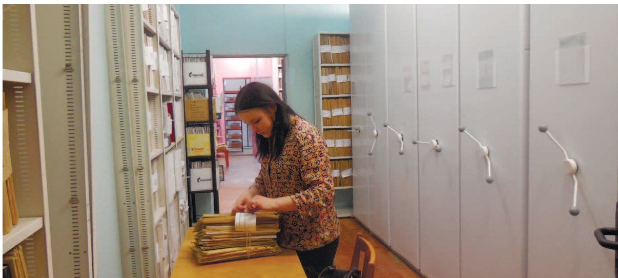
Студенты УрГЮУ за работой в университетском архиве