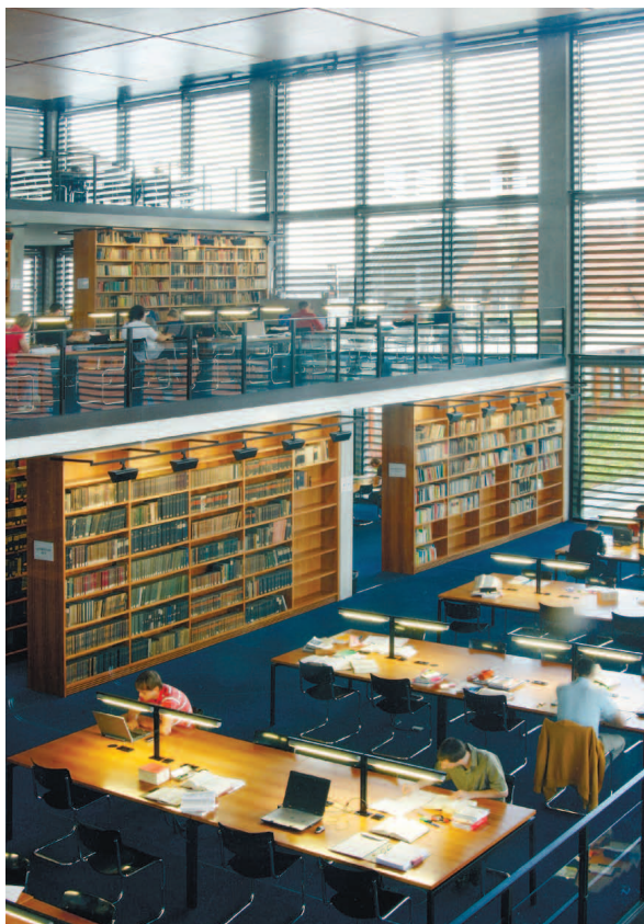
Juridicum университета Галле. Juridicum der Uni Halle.