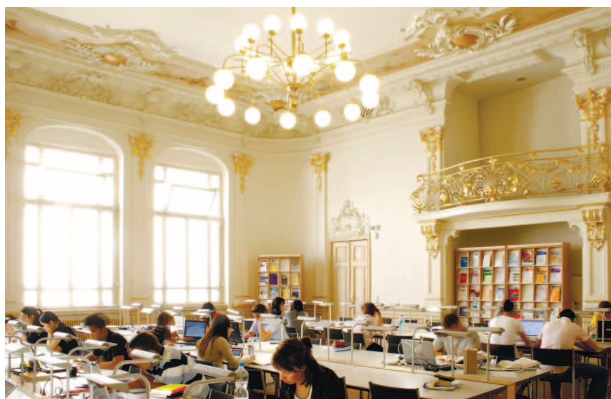
Библиотека экономических наук университета Галле.