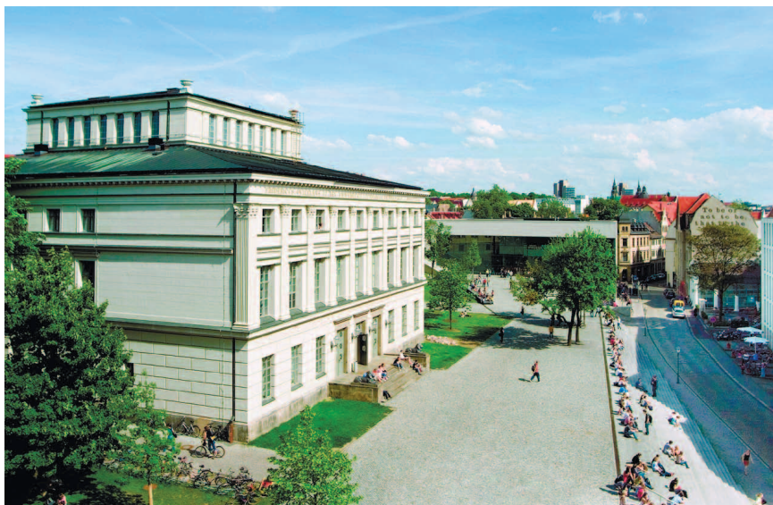
«Здание со львами» на университетской площади.