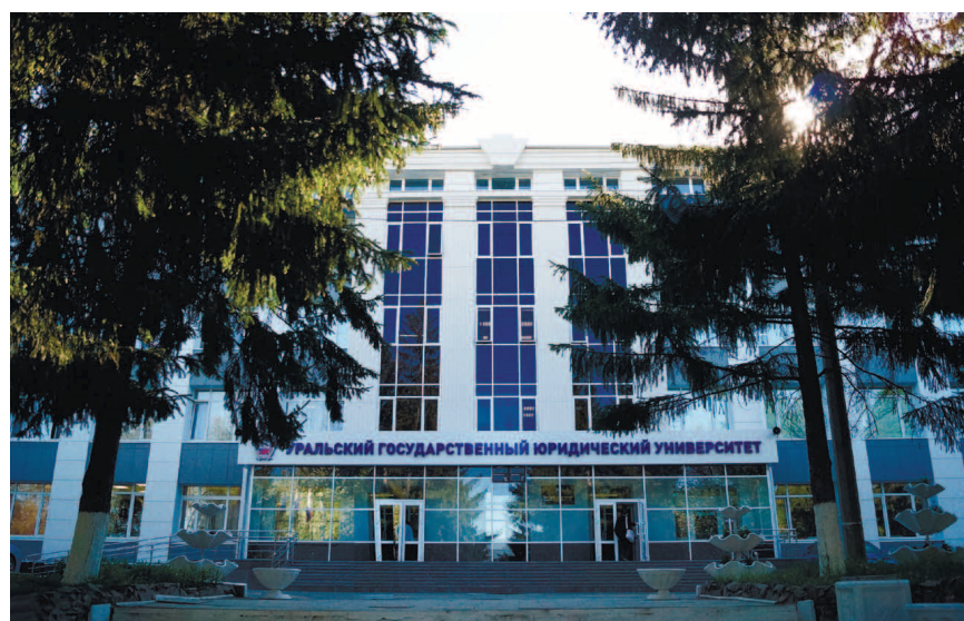
Главный учебный корпус Уральского государственного юридического университета. Екатеринбург, ул. Комсомольская, 21.