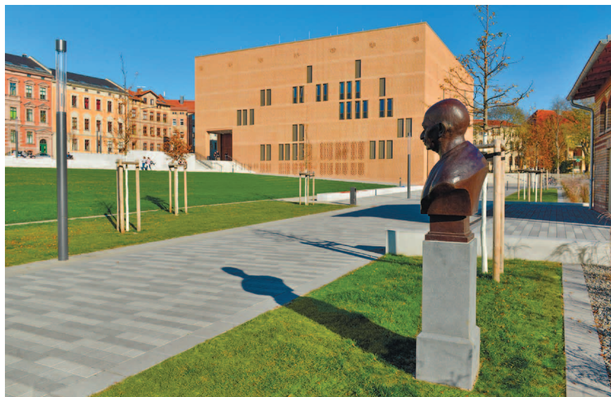
Вид на кампус Штайнтор.

Luftbild Steintor-Campus.