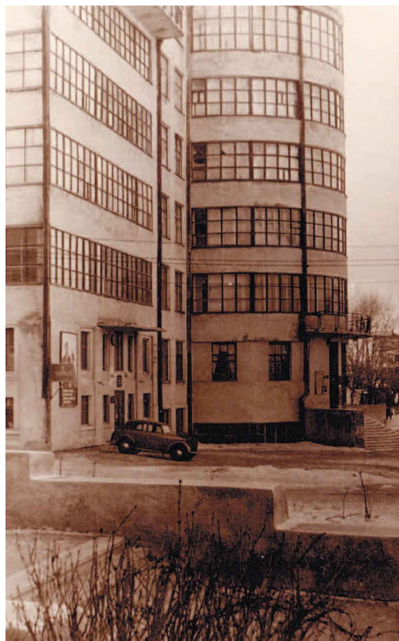
Gebäude, wo das Institut für Sowjetrecht in Swerdlowsk seine Arbeit begann, Swerdlowsk, Malischev Str. 2B.