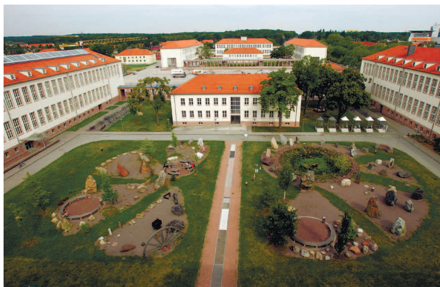
Геологический сад университета Галле.