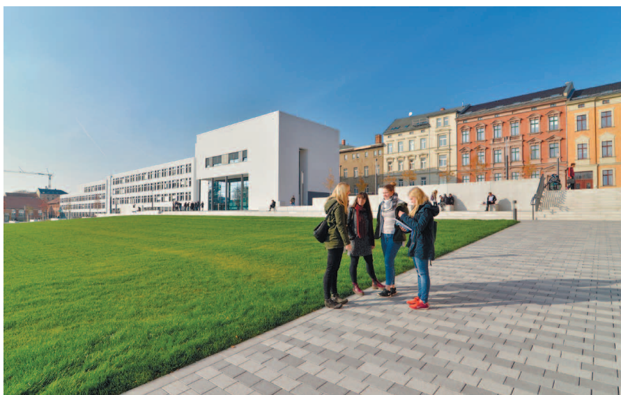
Учебные здания кампуса Штайнтор.

Blick auf den Steintor-Campus.