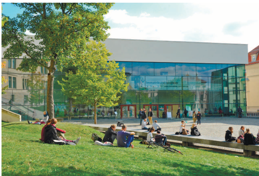
Лекционная аудитория на университетской площади.