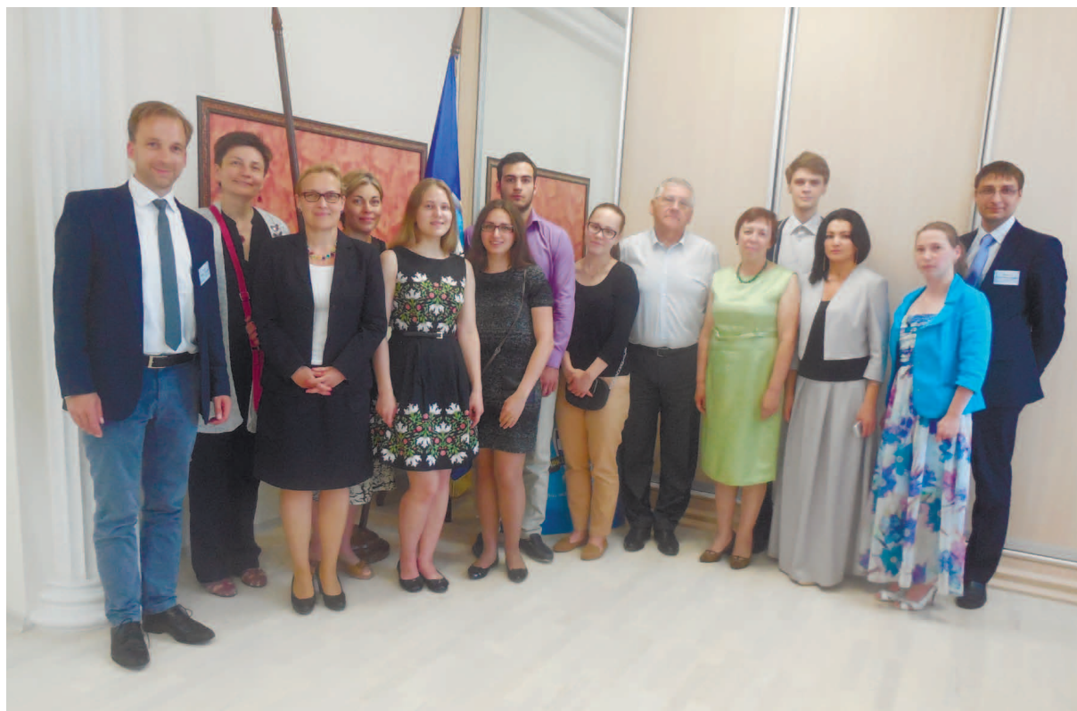
Круглый стол в УрГЮУ (июнь 2016)