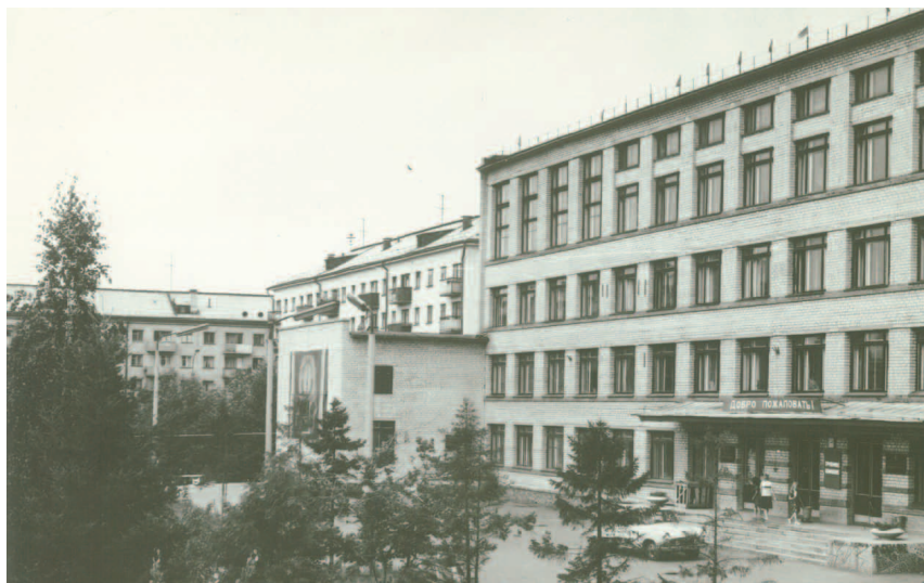
Корпус Свердловского юридического института. Свердловск, ул. Комсомольская, 21. 1970-е гг. Из фондов музея УрГЮУ