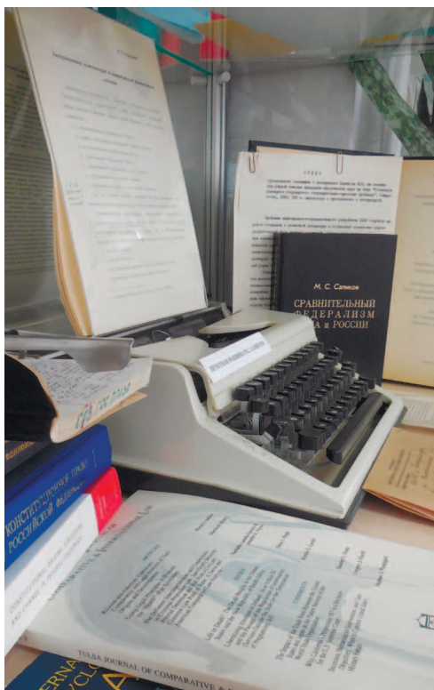
Экспозиция Музея УрГЮУ. Фрагмент.

Zepter der Universität Wittenberg von 1509 (links) und Zepter der Universität Halle von 1694 (rechts).