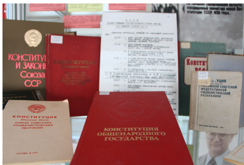
Фрагмент экспозиции, посвященной 20-летию Конституции РФ

Фотоматериалы с этой встречи, равно как и ряд других экспонатов, легли в основу юбилейного выставочного этюда «Конституции РФ – 20 лет», подготовленного как часть большой экспозиции академического музея при участии студентов-исследователей. Были представлены материалы, связанные с развитием Основного закона, разработкой его проектов, а также его осмыслением. Наряду с подборкой изданий советских конституций разных лет, переданных Научной библиотекой Академии, ее преподавателями и студентами, экспонировался архивный документ – план работы кафедры государственного права СЮИ на 1940/1941 учебный год, из которого можно узнать о подготовке выставки к 4-й годовщине Сталинской Конституции.