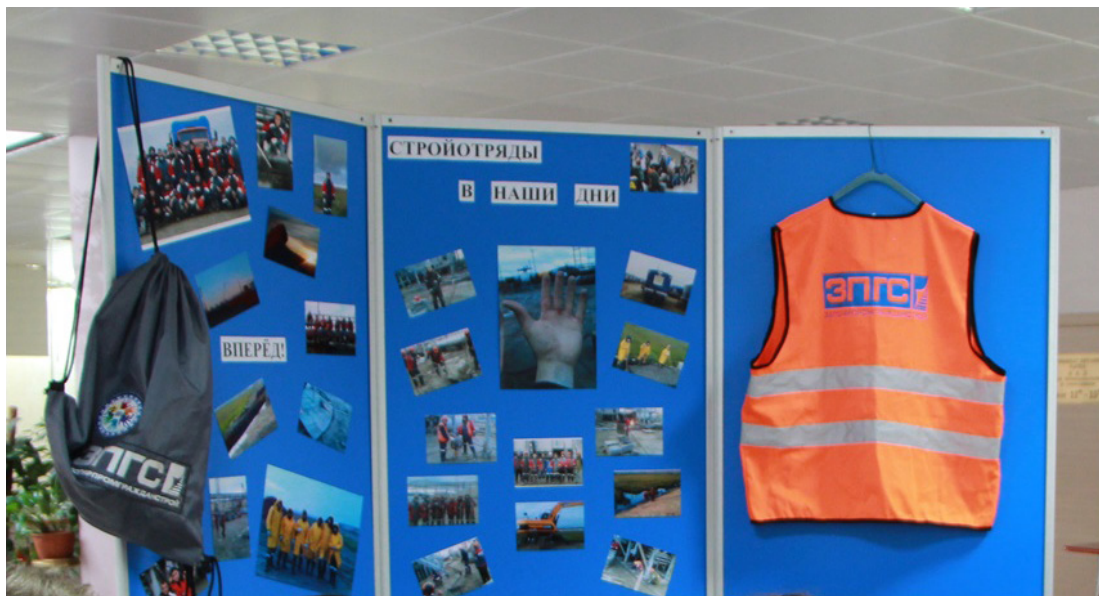
Рамочный стенд с экспонатами выставки

работы», комиссар занимается поддержанием командного духа, организацией различных мероприятий, в том числе творческих (именно поэтому комиссарами могут быть и девушки). Кроме того, в интервью подчеркивалось, что работа в строительных отрядах дает возможность не только заработать деньги во внеучебное время, но и улучшить дисциплину и успеваемость в вузе.