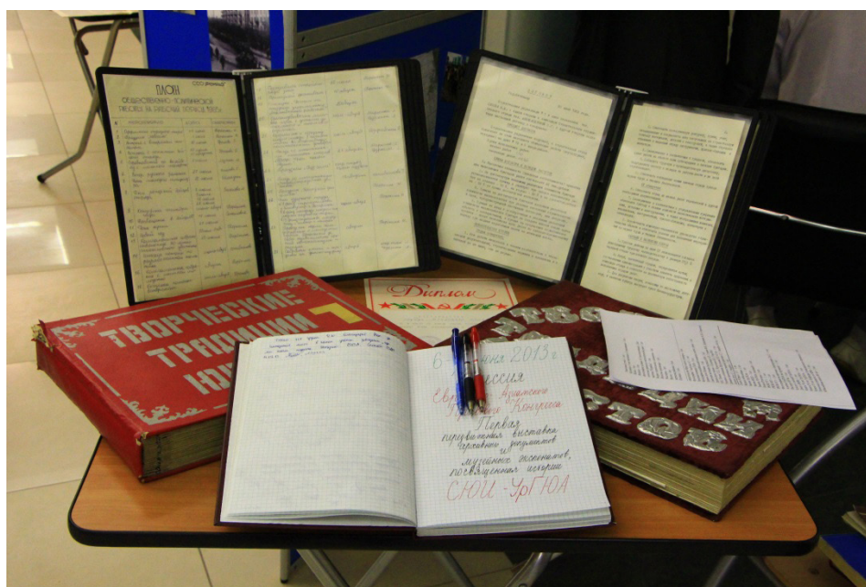
Экспонаты передвижной выставки