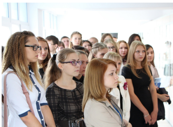
Знакомство с экспозицией