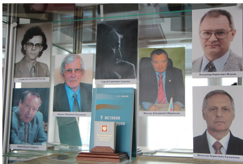
Фрагмент экспозиции, посвященной 20-летию Конституции РФ

На выставке можно было ознакомиться с портретами профессоров, преподавателей и выпускников СЮИ – УрГЮА, работавших над проектами Основного закона, выступавших консультантами. Кроме того, был показан фрагмент протокола № 12 заседания кафедры конституционного права УрГЮА от 25 октября 1993 г. об участии членов кафедры в разъяснительной работе по проекту Конституции среди избирателей.