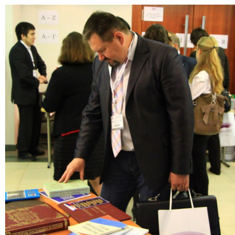
Знакомство участников VII сессии ЕАПК с выставкой