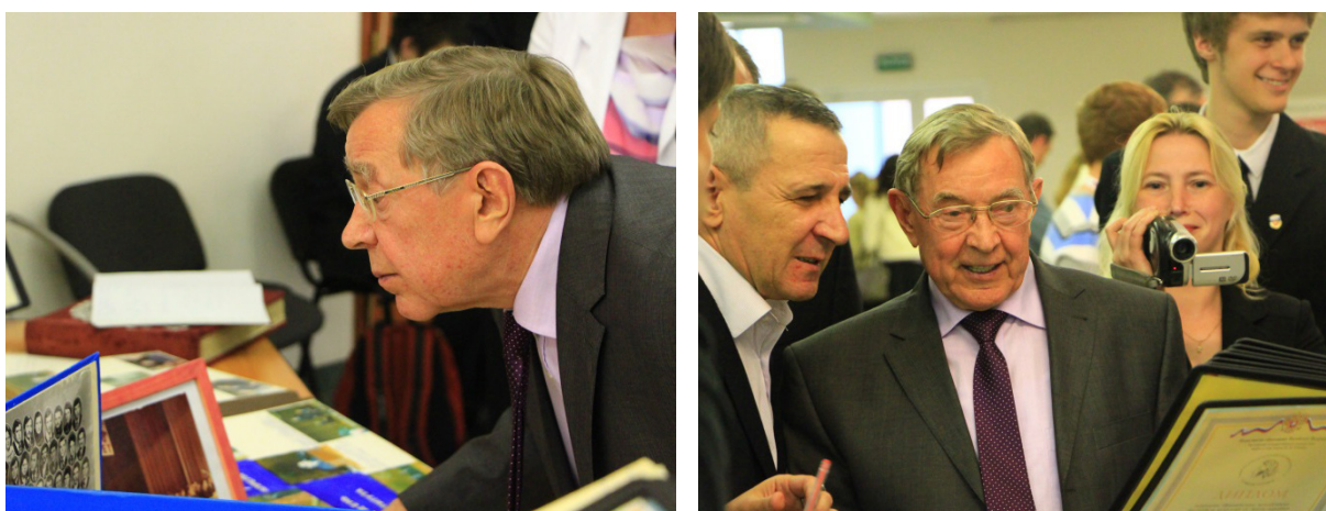
Вениамин Федорович Яковлев

В числе участников конгресса, проявивших интерес к передвижной выставке, был Вениамин Федорович Яковлев, выпускник СЮИ 1953 г., десятки лет проработавший в Alma Mater (преподавателем, деканом вечернего факультета, проректором, заведующим кафедрой). Впоследствии профессор В. Ф. Яковлев был директором Всесоюзного научно-исследовательского института юридических наук (1987–1989 гг.), министром юстиции СССР (1989–1990 гг.), Председателем Высшего Арбитражного Суда СССР (1990–1991 гг.), Председателем Высшего Арбитражного Суда РФ (1992–2005 гг.). В настоящее время член-корреспондент Российской академии наук, заслуженный юрист РФ В. Ф. Яковлев – советник Президента РФ. Вениамин Федорович подсказал исследователям происхождение отдельных фотографий и имена запечатленных на них людей, в частности имена участников научной конференции, состоявшейся в апреле 1976 г.