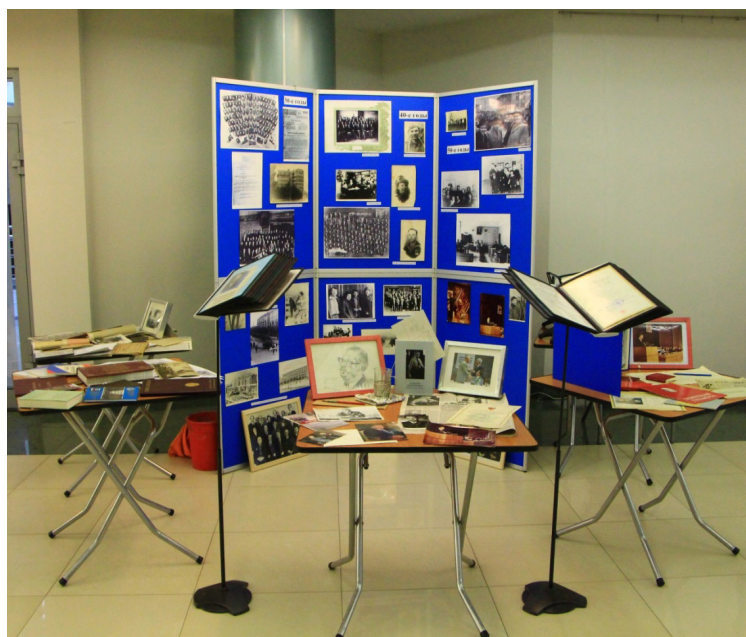
Первая передвижная выставка архивных документов и музейных экспонатов, посвященных истории СЮИ – УрГЮА

Экспонатами передвижной выставки стали юбилейные книги и иные печатные издания, посвященные СЮИ – УрГЮА, медали и значки, студенческие билеты и зачетные книжки 1930–1940-х гг., фотографии директоров (ректоров) вуза, профессорского состава и выпусков разных лет, дипломные работы. Кроме того, демонстрировались почетные грамоты, тетради занятий кружка СНО по советскому трудовому праву начала 1980-х гг., фотосвидетельства мероприятий полувекового юбилея СЮИ (1981 г.), портреты известных выпускников, вещи из так называемых личных коллекций. Были представлены материалы того периода, когда институтом на протяжении более чем трех десятков лет руководил Д. Д. Остапенко, а также сведения о выдающемся ученом С. С. Алексееве. Организаторы выставки преследовали идею показать взаимосвязь истории вуза, юридического образования и науки с общей историей страны. Участники и гости конгресса, среди которых было немало выпускников СЮИ – УрГЮА, имели возможность получить ответы на возникающие при знакомстве с выставкой вопросы, узнать о происхождении экспонатов, их появлении в вузовском музее.