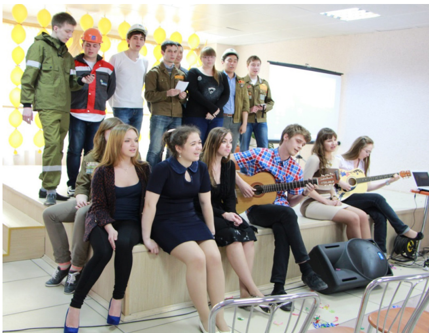
Участники интерактивного открытия выставки

тика объединяла в пары» 1 . Чтобы показать и эту сторону жизни отряда, организаторы мероприятия предусмотрели в программе лирические отступления, во время которых звучали песни «Это ты, наша молодость» и «Изгиб гитары желтой», никого не оставившие равнодушными.