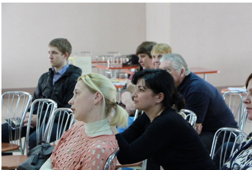
Участники интерактивного открытия выставки

«Студенческий строительный отряд... Нечасто встретишь это выражение, когда в сердцах у многих поколений былых свершений отблески горят!» 1 – эти поэтические строки открыли очередное мероприятие – выставку, которая была организована 21 мая 2013 г. работниками архива и музея УрГЮА (УрГЮУ), студентами-исследователями, занимавшимися в кружке Студенческого научного общества историей российского государства и права, а также началами музейного и архивного дела.