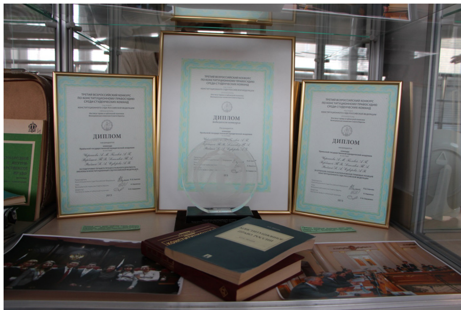
Фрагмент экспозиции, посвященной 20-летию Конституции РФ

В числе экспонатов были Хрустальная Фемида, а также дипломы, привезенные командой УрГЮА после успешного выступления на III Всероссийском конкурсе по конституционному правосудию среди студенческих команд. Отражены материалы Международной конференции «Конституция Российской Федерации: проблемы реализации и перспективы развития конституционализма», приуроченной к юбилею Основного закона и состоявшейся в УрГЮА в октябре 2013 г. 1